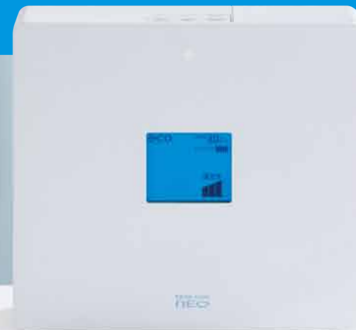
連続生成型電解水素水整水器