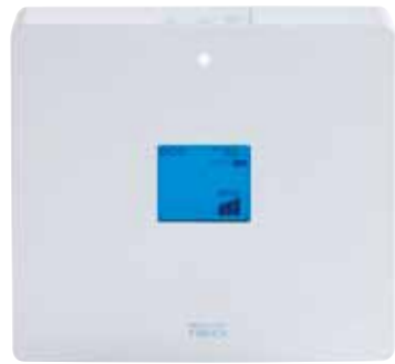
電解水素水整水器