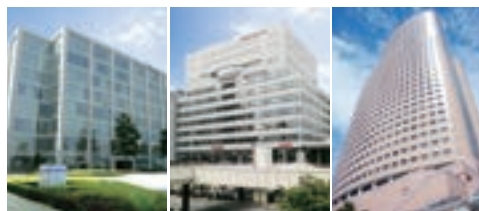
(写真は左から宇都宮、高崎、浜松各営業所の入居ビルです。)

日本トリム スタッフブログでは、今回開設した3営業所の所長からの開設のご挨拶と、それぞれのスタッフからのメッセージを掲載しておりますので是非ご覧ください。