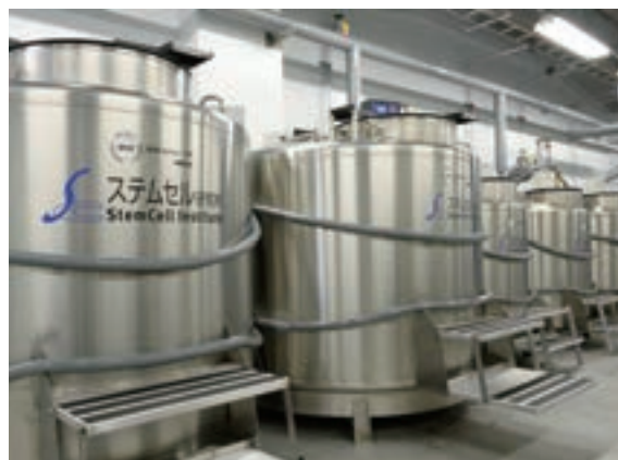
■ステムセル研究所細胞保管センター(横浜市)

民間のさい帯血保管事業最大手である株式会社ステムセル研究所のさい帯血保管数は41,889件(2017年9月末現在)となっており、年々拡大しております。また、本年4月に設立したヒューマンライフコード株式会社におきましても、本年9月に東京大学医科学研究所と共同研究契約を締結するなど、精力的に展開しております。今後大幅な成長が見込まれる先進医療分野において、積極的なM&Aや事業提携により、企業価値の飛躍的拡大に取り組んでまいります。