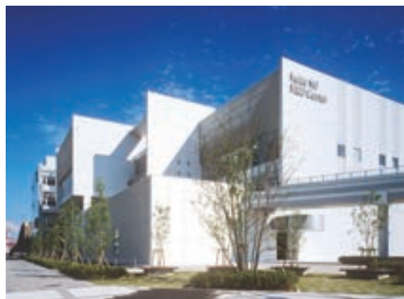
■提供:理化学研究所

本年6月、理化学研究所と日本トリムは電解水素水の機序解明に関する共同研究を開始しました。この研究は、電解水素水の効果についてのメカニズムを、理化学研究所が保有する国内最先端の研究ノウハウや計測技術などを活用して解明することを目的としています。その成果をもとに、これまで蓄積してきた研究成果をさらに発展させ、電解水素水の各分野での事業拡充に積極的に取り組んでまいります。